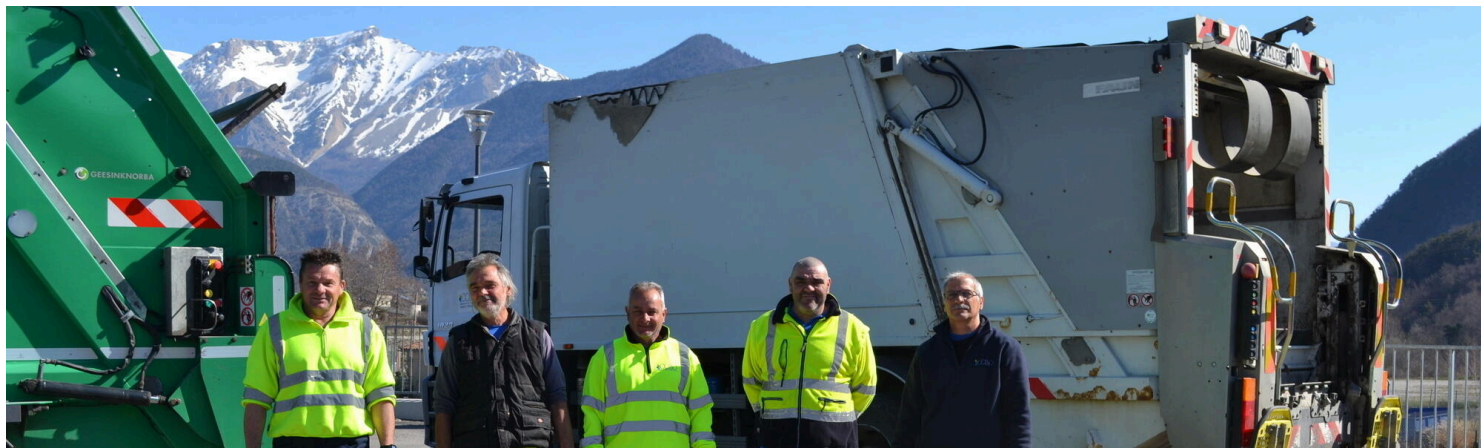
Environnement et gestion des déchets