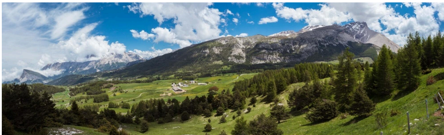
Mon interco : territoire, fonctionnement...